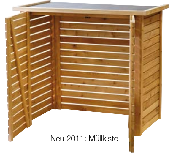
Neu 2011: Müllkiste

Holzterrasse zur Selbstmontage, praktische Müllkiste als Bausatz, hochwertige, großformatige Abtrennung „Raute“. Viele weitere Neuheiten finden Sie auch auf unserer Homepage sowie im Katalog 2011.