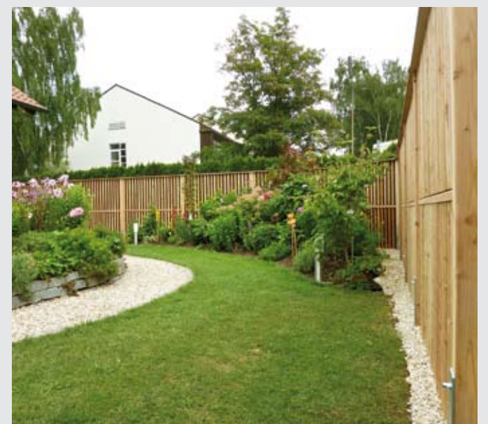
Projekt: Schallschutzzaun in Deutschland, 2010