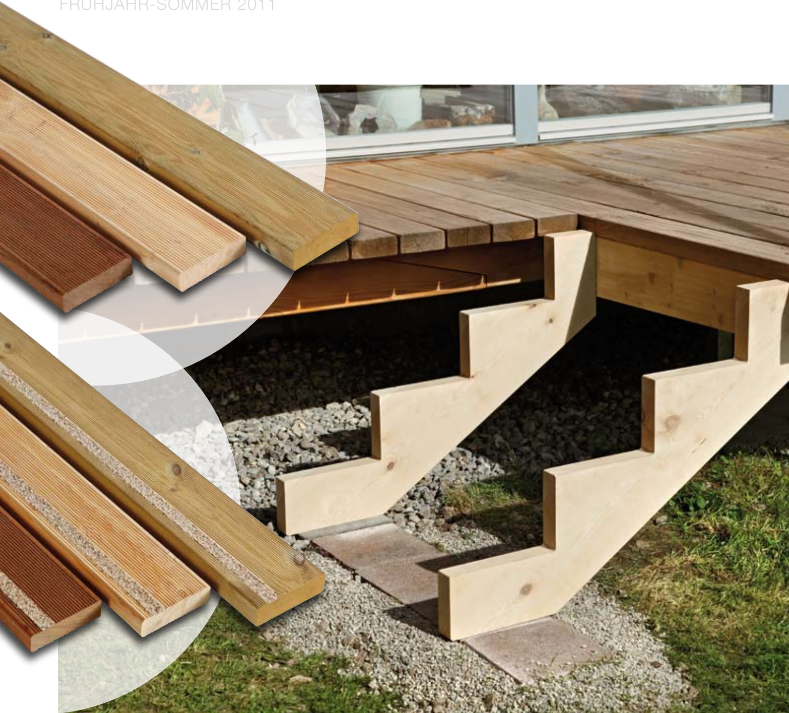
Neue Holzterrasse von B&W aus vorgefertigten Wangen in Kiefer imprägniert sowie Douglasie. Treppenstufen in Kiefer imprägniert, Sibirischer Lärche oder Ipé. Optional mit GripProtect Quarzsandstreifen für den sicheren Lauf.