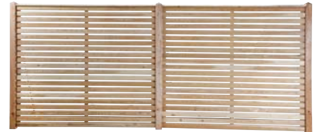
Neu 2011: Abtrennung Raute